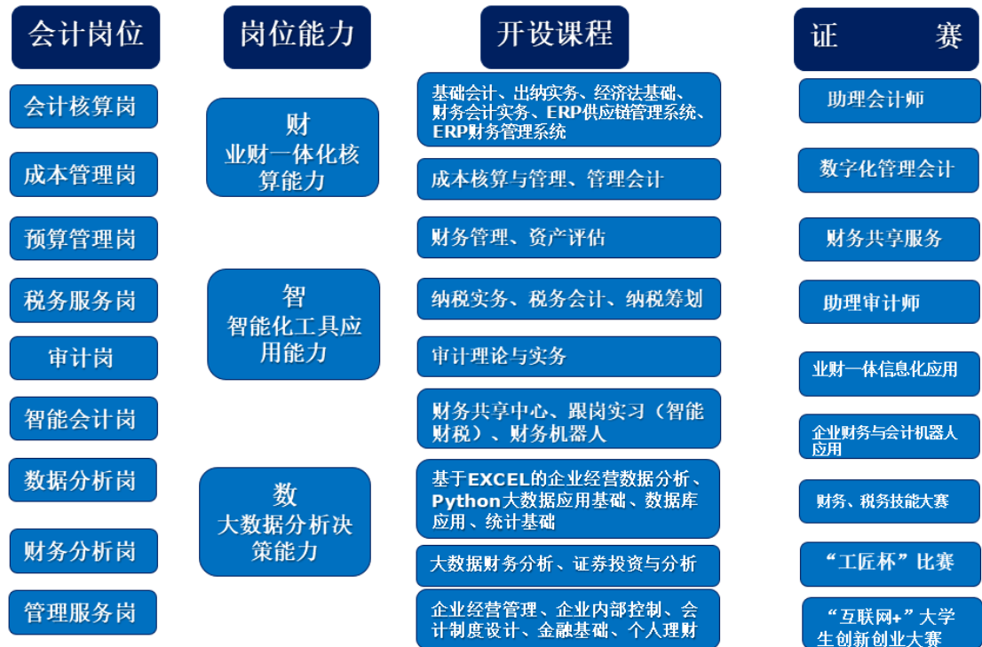
图1 “岗、课、证、赛”智能财务人才培养课程设置